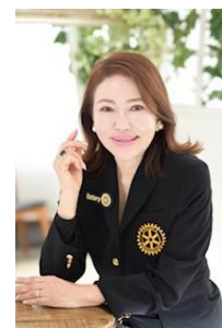
ポリオのない世界まであと少し

世界のどこかにポリオが存在する限り、世界中の子供達が感染の危険に晒されています。この疾病を根絶するために共に行動を起こし、ポリオのない世界を実現しましょう。